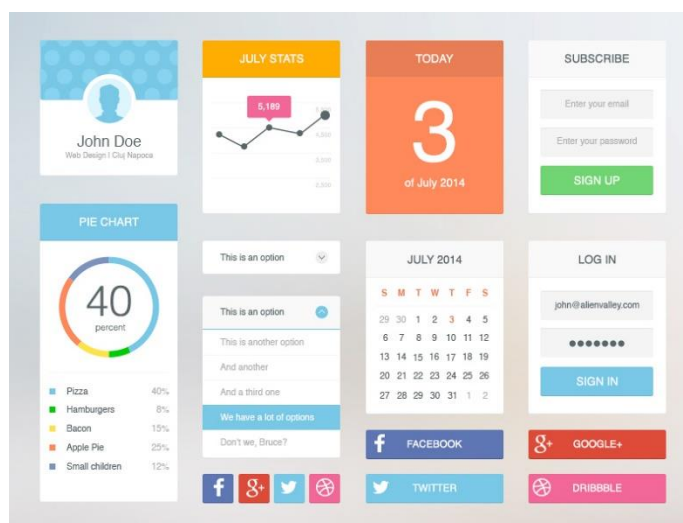
ภาพที่ ง.2 ตัวอย่างออกแบบหน้า UI

7. ขโมยอย่างศิลปิน การจะทำให้ UI Element ง่าย ๆ เช่น ปุ่ม, ตาราง, Popup ฯลฯ ให้ดูดีได้นั้นยากมาก เพราะฉะนั้นเลยใช้วิธีศึกษาจากเว็บไซต์ต่างประเทศหรือเว็บไซต์อื่น ๆ